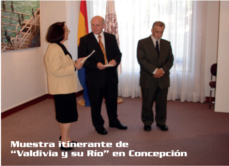
Muestra itinerante de “Valdivia y su Río” en Concepción