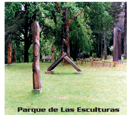
Parque de Las Esculturas

Parque de las Esculturas. 25 esculturas contemporáneas de gran formato en piedra, metal y madera, de artistas chilenos y extranjeros, ubicadas al aire libre y rodeadas por un bello entorno natural, junto a la Laguna de los Lotos. (Parque Saval, Isla Teja / sólo se paga entrada al Parque Saval)